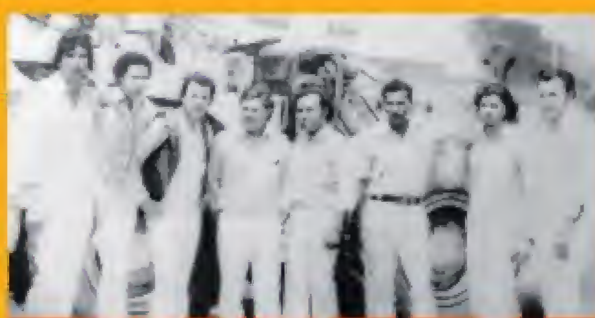
Los Juveniles na Boneiro

Cu Elvia por corda, ta cu Los Juveniles, nan a presenta cu hopi exito na Corsou y na Boneiro. Despues Los Pimentosos a presenta na Berlin (Alemania) y na Hulanda. Los Pimentosos a presenta na Colombia, riba e Plaza Francisco el Hombre durante un festival di vallenato masha reconocí na Valledupar Colombia. Na aña 1994 Vicente a presenta na e festival vallenato, riba invitacion di, e tempo aya e minister di cultura Consuelo Araújo Noguera (dfm), kende tabata presidente tambe di e Fundacion festival vallenato cu ta